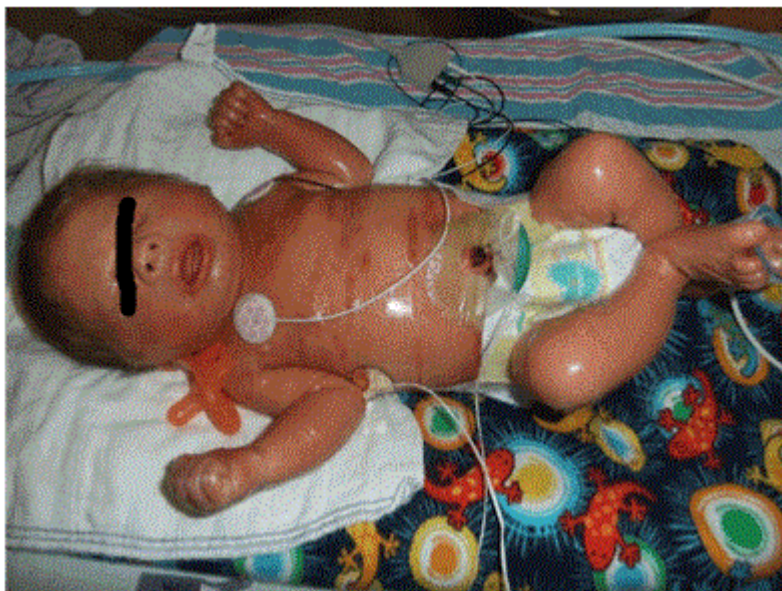
Fig. 2 Congenitale ichtyose (Collodion baby)

Vaak gaat deze neonatale vorm van type II gepaard met faciale dysmorfie. Hoewel faciale dysmorfie vaak voorkomt bij lysosomale stapelingsziekten, is dit over het algemeen niet het geval bij de ziekte van Gaucher. Het vermoeden bestaat dan ook dat de dysmorfie bij deze baby's in utero ontstaat als gevolg van het strakke membraan en de verminderde elasticiteit van de huid.