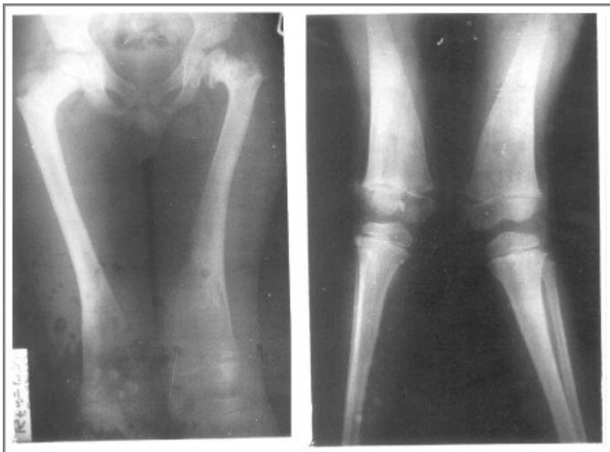
Fig.3 X-ray femur showing markedly reduced bone density, the characteristic Erlenmeyer flask deformity in the distal femur (abnormal modeling of metaphysis), and evidence of healed fracture neck of the right femur in a child 7years old with type 1 Gaucher disease [55].

Zelfs bij het merendeel van volledig asymptomatische Gaucherpatiënten zijn bij radiologisch onderzoek aanwijzingen te vinden voor de aanwezigheid van ossale pathologie.